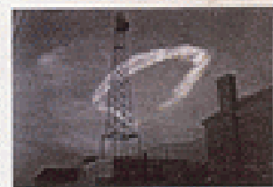
8:10 P.M., N.E. OF PRESCOTT