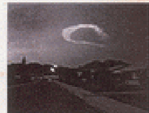
8:15 P.M., N. OF PHOENIX